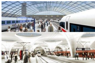
Angebotskonzept Fernverkehr Planungsstand: März 2011